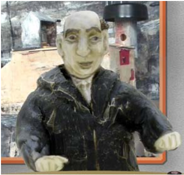
De directeur van de fabriek