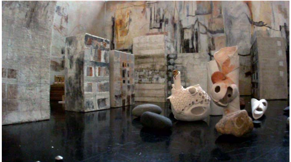
Een plein in sloebertown.

We volgen de belangengroepen en hoe deze op elkaar en op de gebeurtenissen reageren. Er is een directeur van de fabriek, een burgomaster en de abbot van de tempel