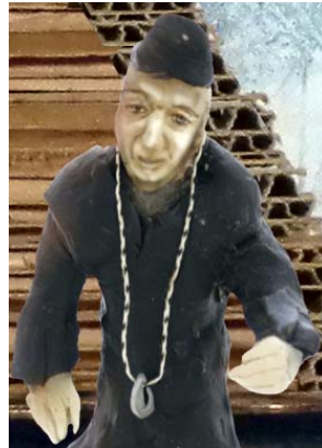
De abbot van de tempel